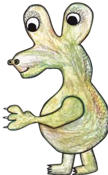
Elon – Patron poznání Autorka: Pavlína Řehulková (ZUŠ Háj ve Slezsku)